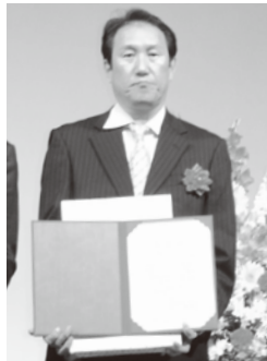
〈衛生管理優良事業場賞〉 ゼンミ食品(株)