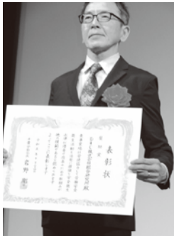
〈健康確保対策(有害物)〉 D I C(株)総合研究所