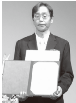
〈安全管理優良事業場賞〉 株協成 成田芝山工場