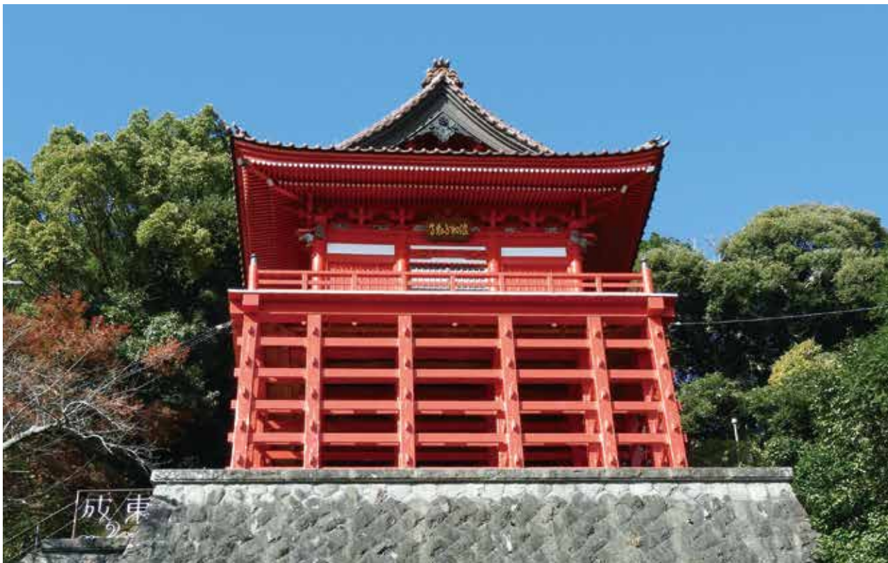
成東山 浪切不動院